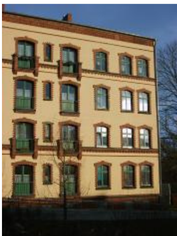
Sanierter Altbau

Beispielhafte Erschließung hoher Einsparpotenziale bei der Sanierung von Altbauten in einem Projekt der Deutschen Energie-Agentur