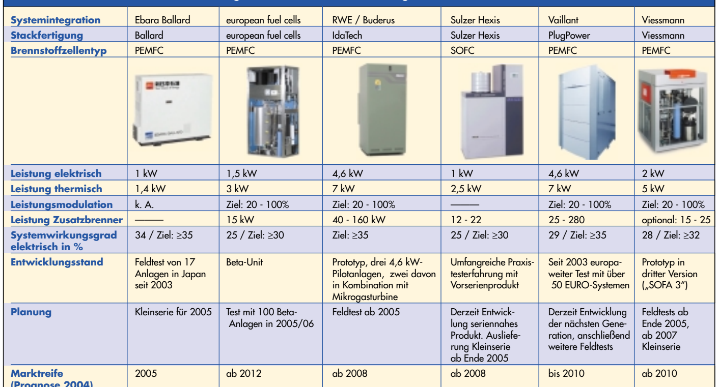
Abb 3: Kenndaten verschiedener Entwicklungslinien von Brennstoffzellen-Heizgeräten*

Stand August 2004. *Alles Herstellerangaben.