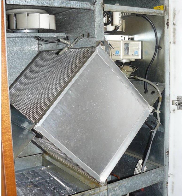
Abbildung 8 - Lüftungsgerät 2. Generation (circa 3-4 Jahre in Betrieb)