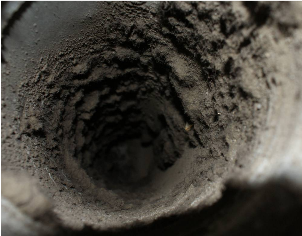
Abbildung 6 - Außenluftsegment zwischen Außenregister und Lüftungsgerät

Das Außenluftrohr weist starken Belag auf: