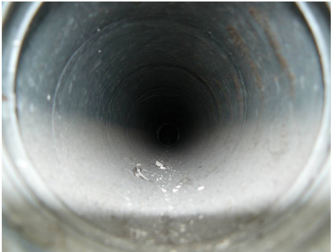
Abbildung 3 - Zuluftrohrsegment Schlafzimmer - Putzreste sichtbar