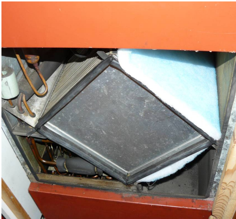
Abbildung 7 - Lüftungsgerät 1. Generation (circa 25 Jahre in Betrieb)