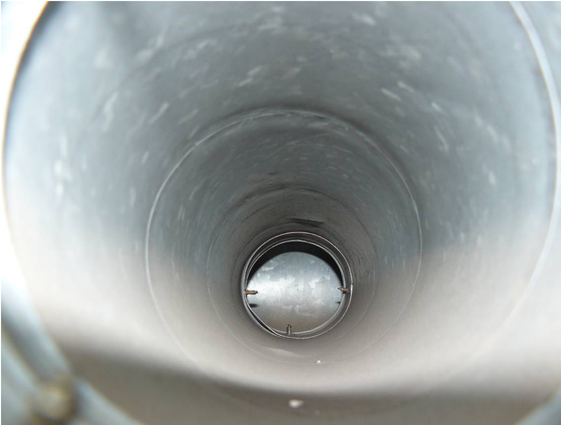
Abbildung 2 - Zuluftrohrsegment Wohnzimmer