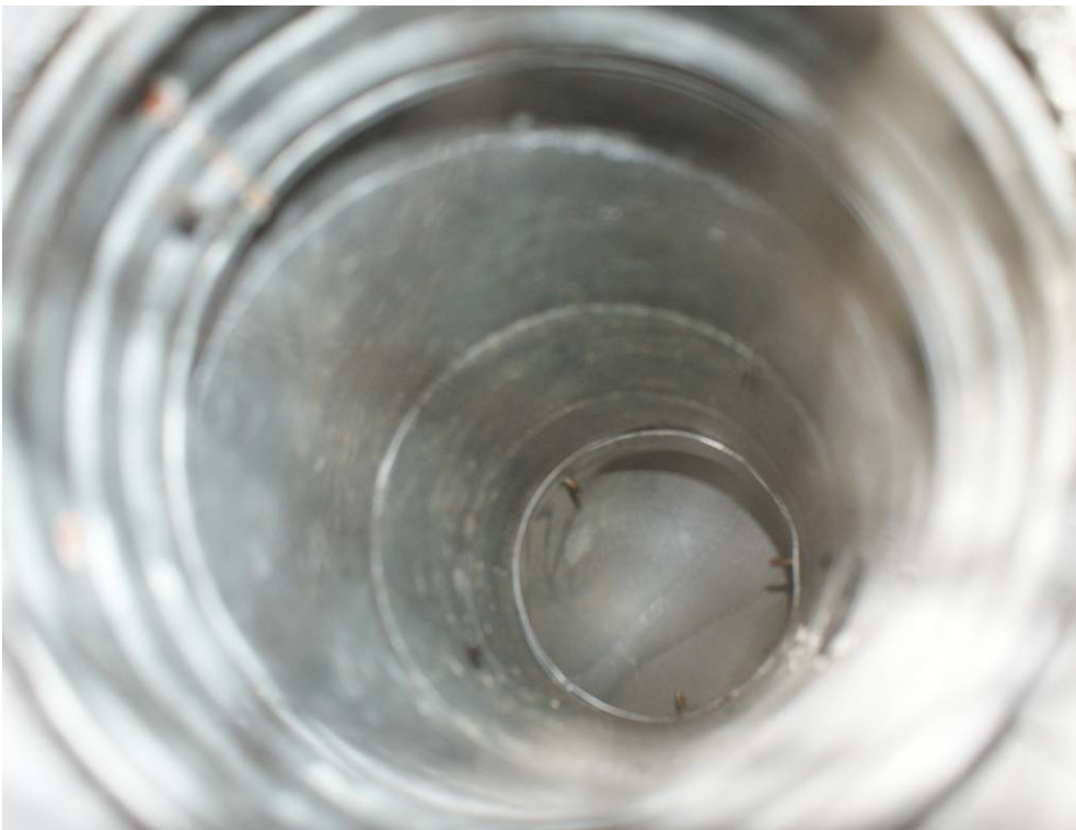
Abbildung 5 - Fortluftsegment zwischen Außenregister und Lüftungsgerät

Das Fortluftrohrsegment erscheint sauber: