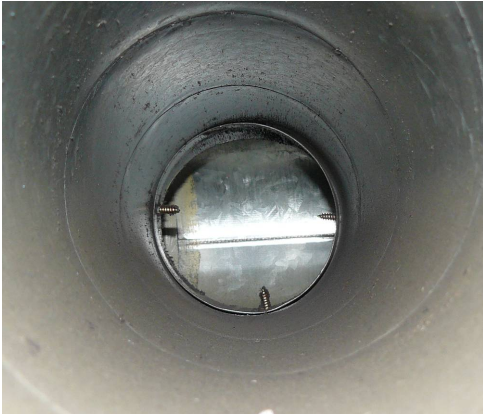
Abbildung 4 - Verbindungsstück mit Übergangsspalt und Blechschrauben

Das Fortluftrohrsegment erscheint sauber: