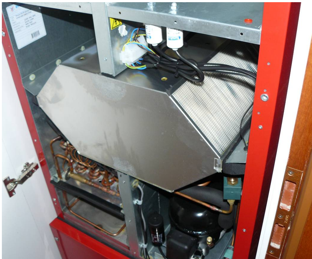
Abbildung 9 - Lüftungsgerät 3. Generation (circa 1-2 Jahre in Betrieb)